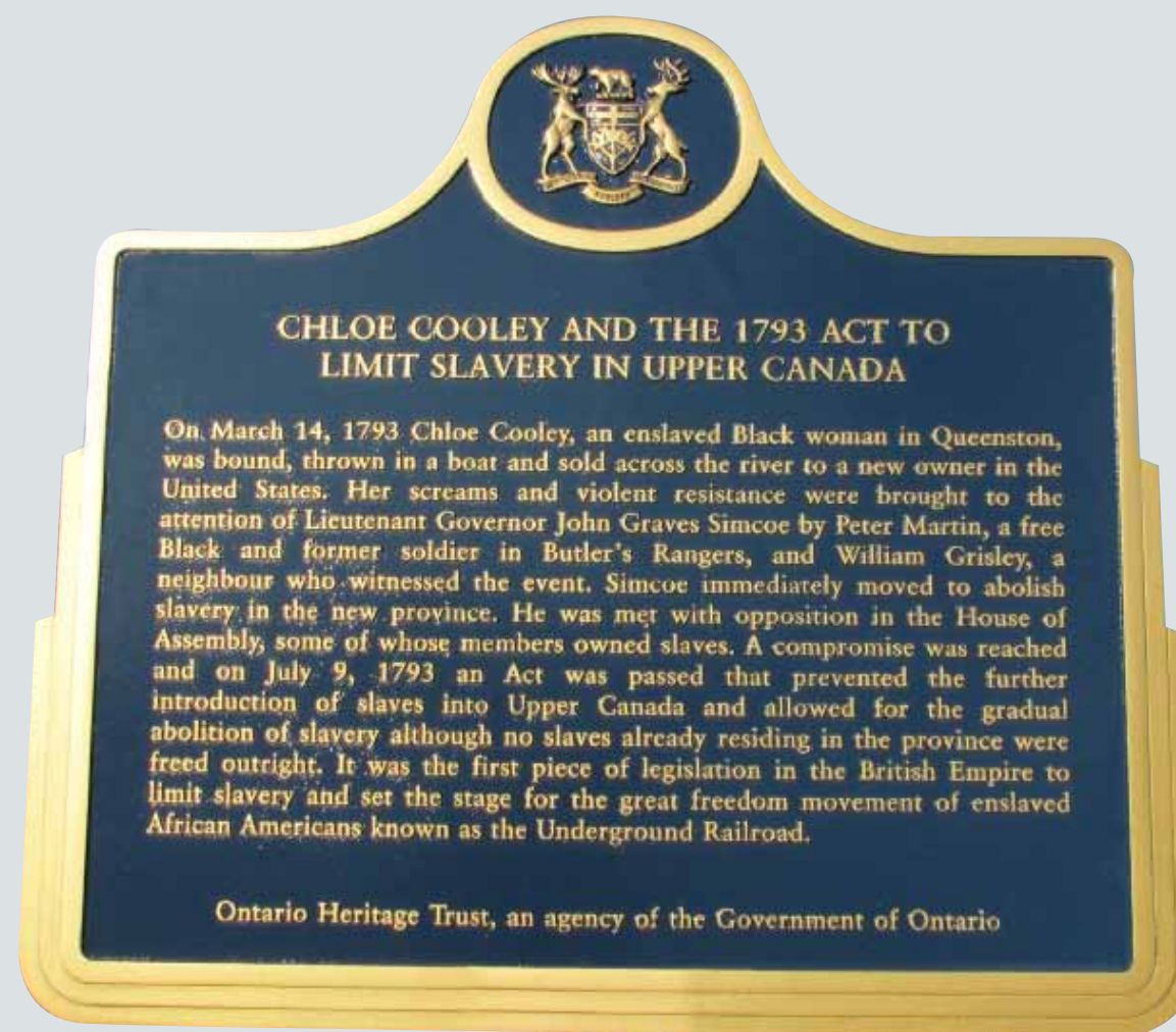
There is an Ontario provincial plaque to Chloe Cooley located on the east side of the Niagara Parkway, near Vrooman's Point, in Niagara-on-the-Lake.

« La loi sur l'esclavage a fait l'objet de la plus forte résistance; de nombreux arguments plausibles quant à la cherté du travail et à la difficulté d'obtenir des serviteurs pour cultiver les terres ont été avancés [ . . . ] La question a finalement été résolue en convenant de préserver la propriété déjà acquise à condition que l'importation d'esclaves cesse immédiatement et que l'esclavage soit progressivement aboli. » (Simcoe à Dundas, Le 16 septembre 1793. Traduction libre.)